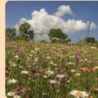
národní přírodní rezervace Kralický Sněžník