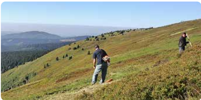
Vybraným stanovištím a druhům rostlin i živočichů svědčí tradiční způsoby hospodaření, jako je kosení...

Chráněná území zpravidla potřebují naši péči (např. kosení luk, obnovu mokřadů a tůní, vyřezávání náletových dřevin), která zajišťuje chráněným druhům a stanovištím správné podmínky pro život a rozvoj. Většinou se přitom neobejdeme bez dlouhodobé spolupráce s vlastníky či hospodáři.