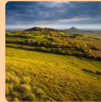
chráněná krajinná oblast České středohoří

Národní parky (NP) jsou rozsáhlá území, ve kterých chráníme především přírodní procesy. Na velké části z nich můžeme pozorovat, jak funguje příroda bez zásahu člověka. V České republice máme 4 národní parky.