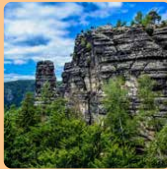
národní park České Švýcarsko

Naše chráněná území si představujeme spíše jako jeden celek, který má dvě vzájemně se prolínající vrstvy – evropskou a národní.