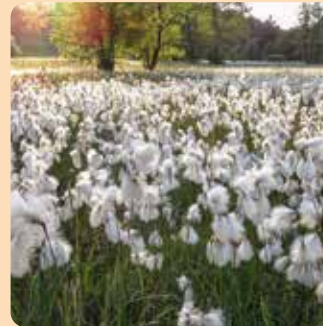
přírodní rezervace Damašek