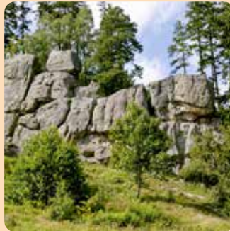
přírodní památka Čertovy skály

V chráněných krajinných oblastech (CHKO) chráníme především krajinné scenérie a zachovalou přírodu. Ochrana přírody zde převážně není tak přísná jako v národních parcích. Máme jich 26.