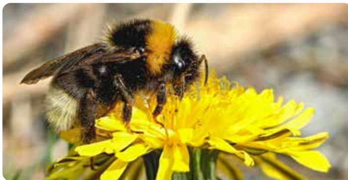
Opylování jako významná ekosystémová služba. Bez hmyzu, který opyluje rostliny, bychom si většinu zemědělských plodin nevypěstovali.

Jsou-li příroda a ekosystémy narušeny, pak ztrácejí svou schopnost přinášet lidem užitek. Aby zůstaly zachovány, je nezbytné rozmanitou přírodu chránit . A právě to je cílem evropské soustavy Natura 2000 i dalších chráněných území.