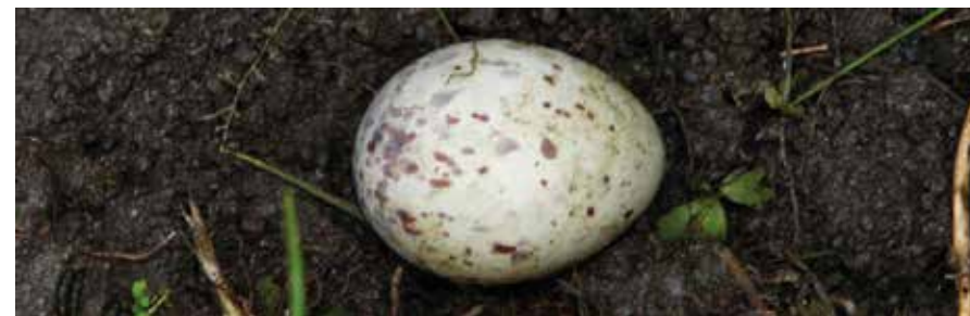
Chřástalí vejce váží sotva třetinu toho, co vejce slepičí.