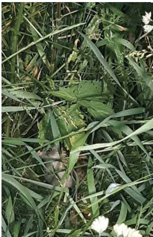
Chřástala si v porostu sotva všimnete.

Chřástalové jsou ohroženi posečením lokality během hnízdění v červnu až červenci a potom i v srpnu během přepelichávání, kdy nejsou schopni letu. Koncem srpna chřástalové odlétají zpět do Afriky.