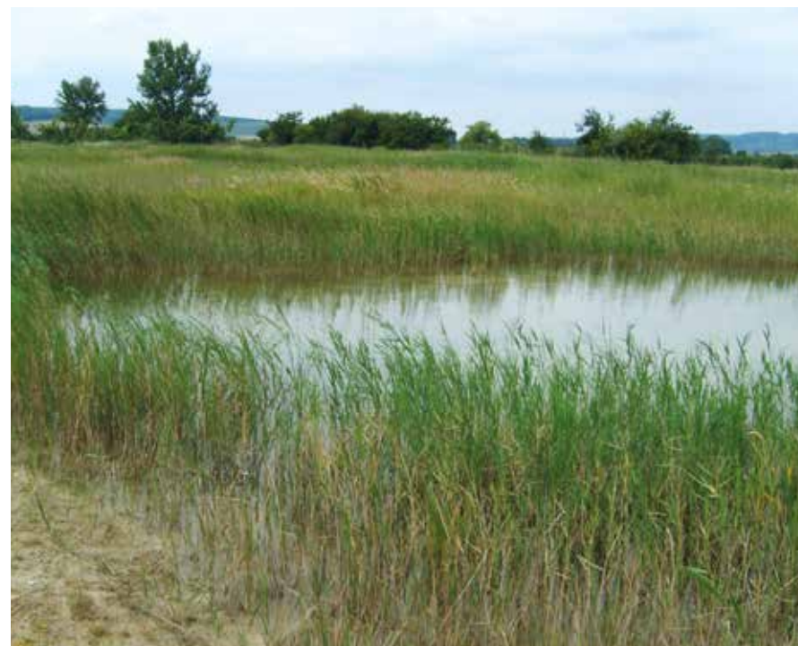
Slanisko Záповěď u Terezína