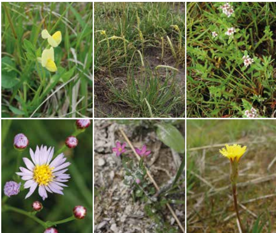
Shora zleva: Ledelec přímořský, jitrocel přímořský brvitý, sivěnka přímořská, hvězdnice panonská pravá, zeměžluč spanilá, hadí mord maloúborný.

Vzácné druhy rostlin a živočichů potřebují ke svému životu právě tato specifická stanoviště. Proto je nenajdeme jinde než na slaniskách nebo až na mořském pobřeží.