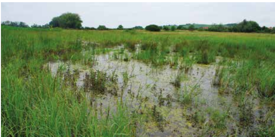
Slanisko u Nesyty na jižní Moravě

Podrobnější informace o jednotlivých stanovištích chráněných evropskou soustavou Natura 2000 a jejich rozšíření naleznete zde: https://portal.nature.cz ▶ Datové zdroje ▶ Registry ▶ Seznam habitatů.