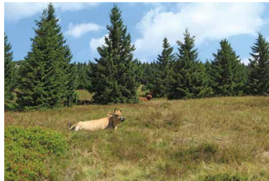
Pastva skotu v Krkonoších